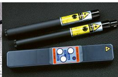
レーザーポインター