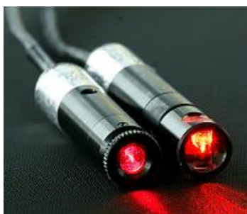
システム可視光レーザーマーカ