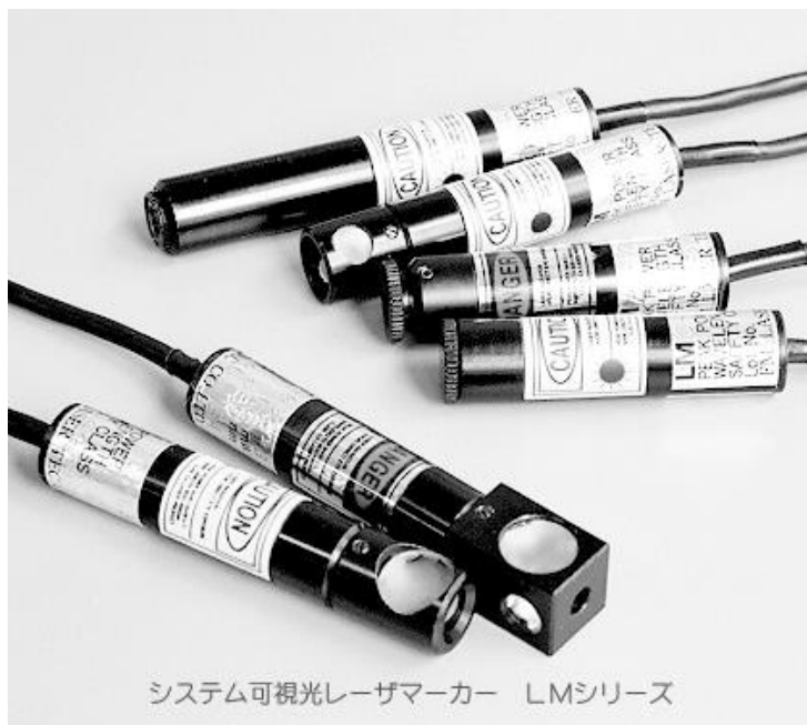
システム可視光レーザーマーカー LMシリーズ